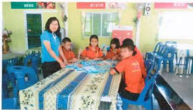
ฐานกิจกรรมการเรียนรู้การใช้ประโยชน์จากวัสดุเหลือใช้ของนมโรงเรียน