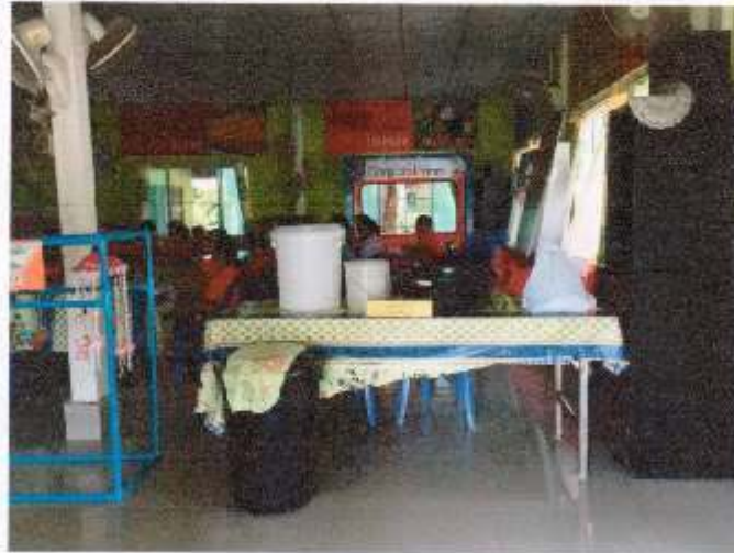
ฐานกิจกรรมการเรียนรู้น้ำท่วมกับชีวิตจากหลักศพชชว