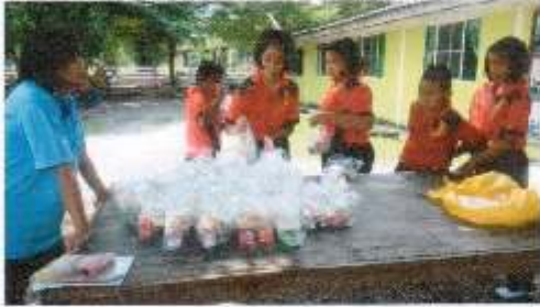
รับประทานอาหารกลางวันพร้อมเรียนรู้การพับก๊อปปี้และ ถุงพลาสติก