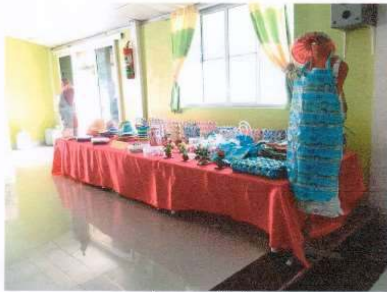
ฐานการบรรยายเรื่องกรมยกย่องให้คู่ค้าริเริ่มหลัก 5Rs