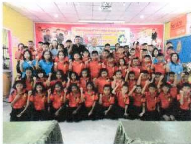
พิธีเปิดโครงการรณรงค์ให้ท วมรู้แก่เด็กและเยาวชนในการคัดแยกขยะตามหลัก 5R.